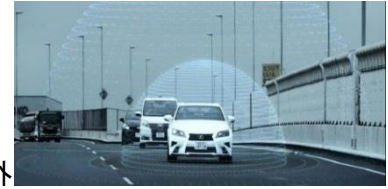
高速道路における自動運転（イメージ）