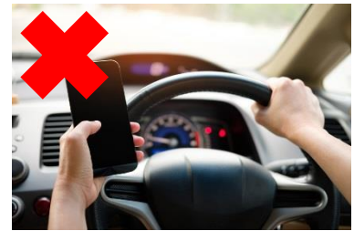
運転中の携帯電話使用等の禁止