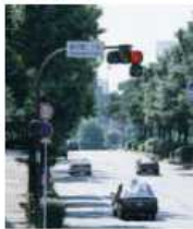
歩車分離式信号機