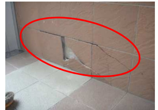
警察学校 壁崩落の状況