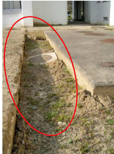
警察学校 地盤沈下の状況