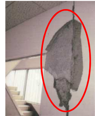
警察学校 壁崩落の状況