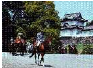
信任状捧呈等に伴う護衛