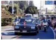
行幸啓等に伴う護衛