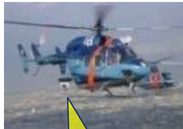
警察ヘリコプターテレビシステム