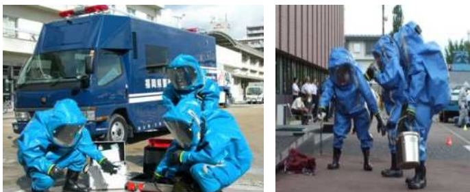
NBCテロ対応専門部隊