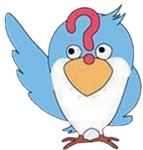
イメージキャラクター うたとり