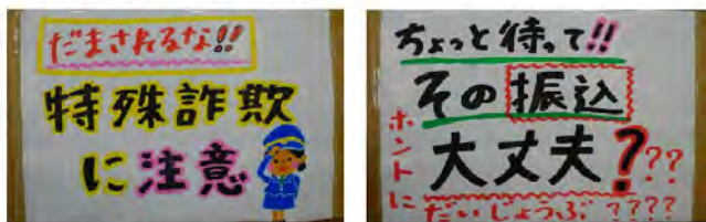
看板を作成しアピール「大きく伝えよう」

私達は、自然景観に恵まれた伊勢志摩国立公園の中で暮らしています。志摩市民の多くは、観光の仕事や、観光客に美味しいお魚を提供する漁業に従事しています。環境が悪化すれば美味しいお魚もいなくなってしまう、人も訪れてくれなくなるでしょう。環境だけでなく、人の心もきれいにするのも大切です。人と人とのつながりを強化し、防犯意識を広げていくことが、安全・安心につながっていくと思います。