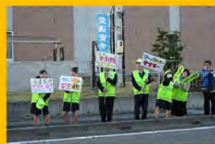
配布物も工夫して、自分たちでメッセージを考えてみることに...