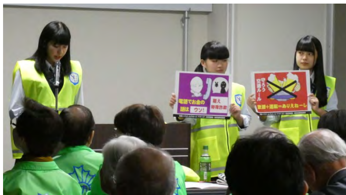
Shima High School Patrol～アフターG7～発足と、イメージマーク

お揃いのベストは防犯協会の方が用意してくれ、マークは地元のデザイナーさんが、高校生のアクティブさ、楯の下にあるイカリはチームの信頼と安定、真ん中にある灯台は犯罪を未然に防ぐために周囲を照らす光、「H」の上にある丸型は真珠をイメージし、「Shima High School Patrol ～アフターG7～」によって守られるべき「志摩」を象徴するものとしてデザインしてくれました。