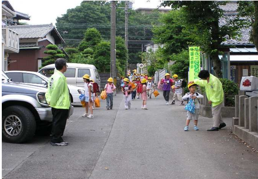
子どもたちの笑顔を守る『見守り活動』