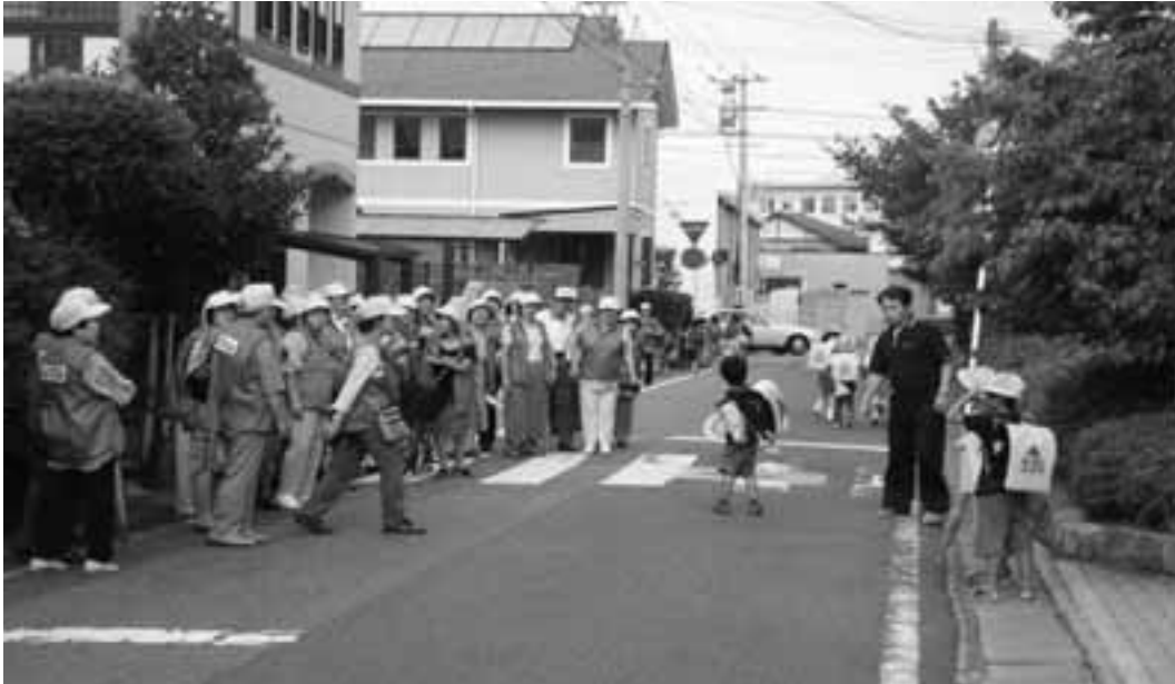
雨、風、大雪の日も心は感謝のパトロール

防犯パトロール等の防犯活動のほか「オバパト大学」を設立、地域住民との交流を図りながら地域の防犯意識を高める活動を展開している。