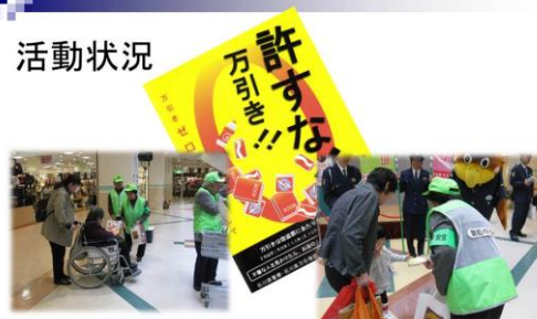
ショッピングセンターでの「万引き防止キャンペーン」