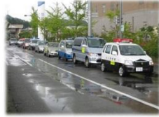
パトカーと青パトのパレード

私たち作見地区では、毎年夏から秋にかけ、作見地区防犯交通安全大会という防犯、交通安全の決起集会を行っています。大会では、大聖寺警察署長をはじめ、警察関係者、そして加賀市長も参加し、安全宣言を行い、最後はパトカーと青パトでのパレードを行っています。私たち、パトロール隊も毎年参加しており、10台ほどの青パトでパレードを行っています。