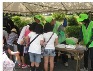
「子どもまつり」における防犯クイズの実施