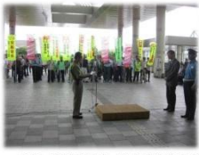
市長、警察署長に対する安全宣言