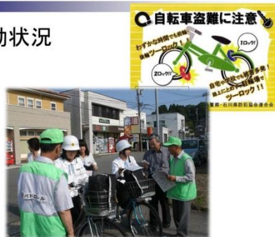
自転車マナーアップ・鍵かけキャンペーン