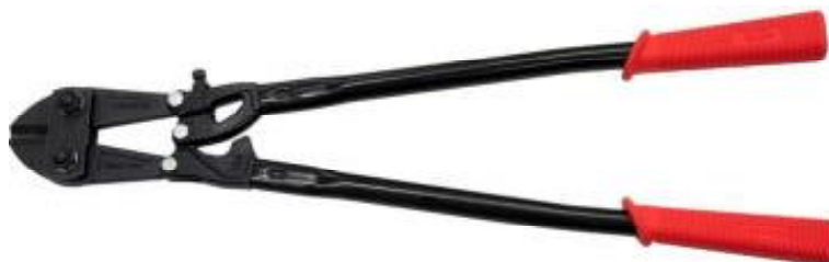
手動両手式のボルトクリッパー

なお、ボルトクリッパーという商品名で販売されていなかったとしても、鉄筋等の鋼材を切断するための工具として設計、製造又は販売されているものについては、ボルトクリッパーに該当する。