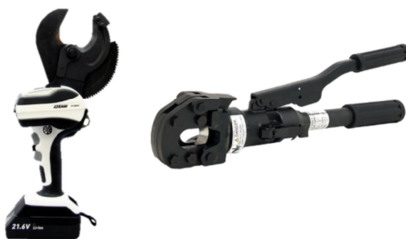
(左) 電気装置を備えたケーブルカッター