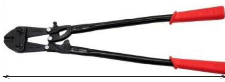
ボルトクリッパーの「長さ」

なお、ラチェット機構を備えているボルトクリッパーは、現時点、国内でほとんど流通しておらず、また、唯一警察庁で把握している製品も全長が75センチメートルを超えていることから、独立した要件としては設けていない。