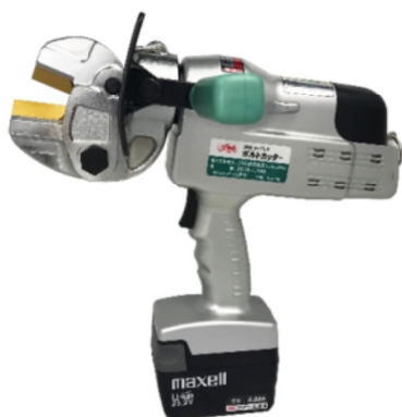
電気装置及び油圧装置を備えたボルトクリッパー