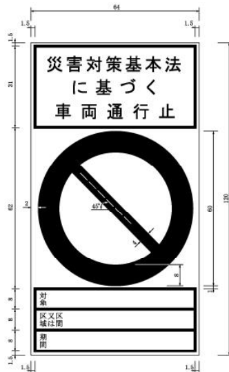
別記様式第2（第5条関係）