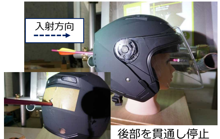
科学警察研究所における実験 (合成樹脂製ヘルメットに対する射撃実験)