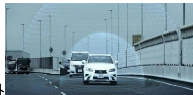
高速道路における自動運転（イメージ）