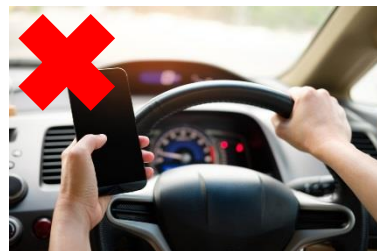
運転中の携帯電話使用等の禁止