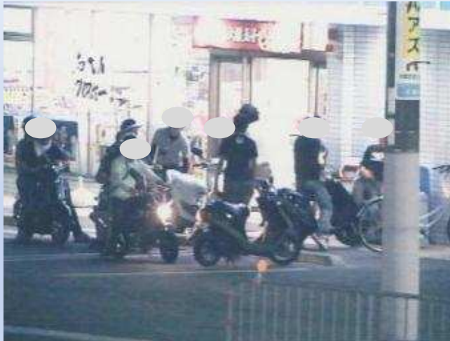
暴走前に集まる暴走族集団