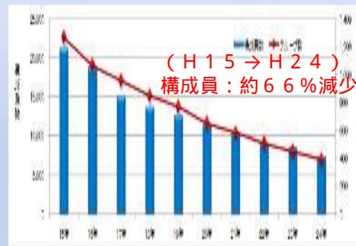
グループ・構成員