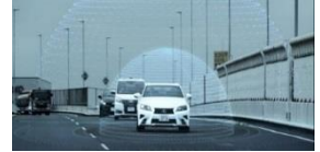
高速道路における自動運転（イメージ）