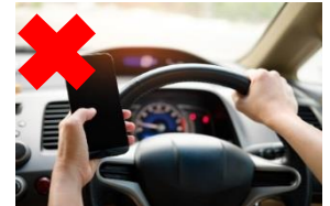
運転中の携帯電話使用等の禁止