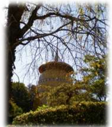
高尾みころも霊堂