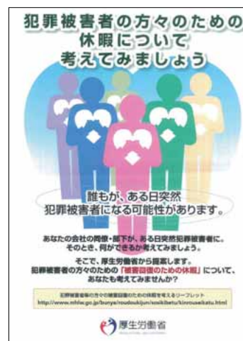
被害回復の休暇制度に関するポスター

厚生労働省において、平成18年度、犯罪な どの被害に遭った労働者が被害を回復するた めの休暇制度の導入につき、アンケートを実 施したところ、企業、労働者とも約9割が、 同制度を導入すべきという意見さえ知らない という状況が明らかになった。そこで、まず は企業や労働者に対し、同制度の必要性につ いての周知・啓発を図ることが重要である との結論に至り、19年度から幅広く周知・啓 発を行っている。22年度においても、21年度 に引き続きリーフレットやポスターを作成す るとともに、セミナーの開催などにより、引 き続き、企業や労働者に対する周知・啓発を 行うこととしている。