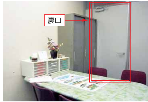
相談室には通常入口の他、人目につかずに出入りできる裏口がある