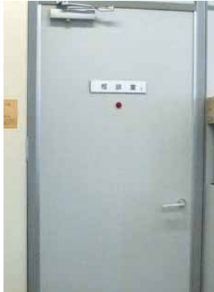
犯罪被害者等専用の相談室