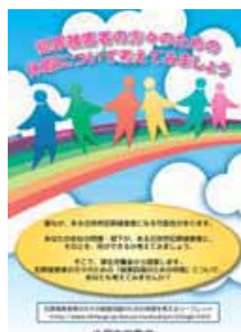
被害回復の休暇制度に関するポスター

めの休暇制度の導入につき、アンケートを実施したところ、企業、労働者とも約9割が、同制度を導入すべきという意見さえ知らないという状況が明らかになった。そこで、まずは企業や労働者に対し、同制度の必要性についての周知・啓発を図ることが重要であるとの結論に至り、19年度から幅広く周知・啓発を行っている。21年度においても、20年度に引き続きリーフレットやポスターを作成するとともに、セミナーの開催などにより、引き続き、企業や労働者に対する周知・啓発を行うこととしている。