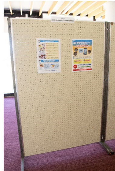
総合通信基盤局電気通信事業部利用環境課