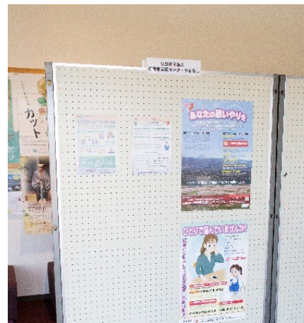
公益社団法人 被害者支援センターやまなし