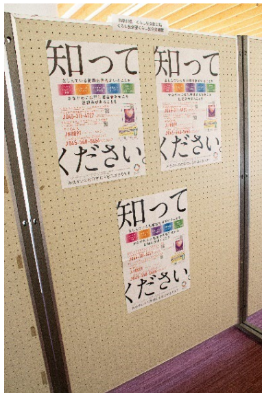
くらし安全部 くらし安全交通課