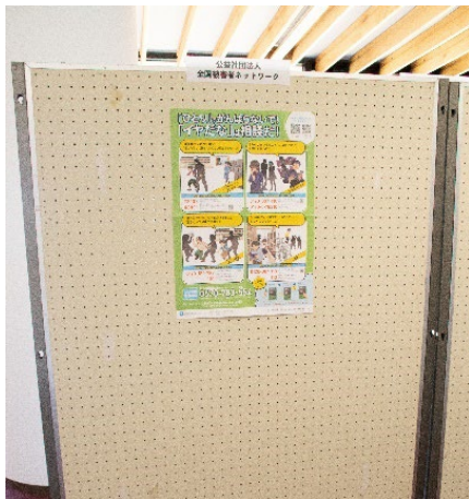
公益社団法人 全国被害者ネットワーク