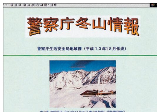
山岳情報の提供（警察庁ホームページ）

等を行っているほか、山岳パトロール等の活動を通じて登山の安全に関する指導を行っている。