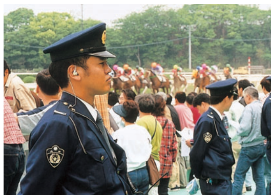
公営競技場における警備活動

を要請しているほか、競技開催の都度、警察官の派遣等により雑踏事故及び紛争事案の未然防止に努めている。