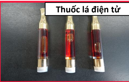
Thuốc lá điện tử