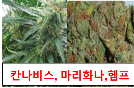
칸나비스, 마리화나, 헴프