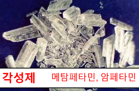
각성제 메탐페타민, 암페타민

*일본 내 대마초 사용과 일본으로부터의 신중 향정신성 물질(NPS) 수출은 현행법상 금지되어 있지 않습니다.