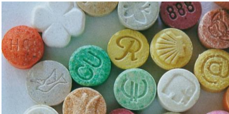
เอ็มดีเอ็มเอ (ยาอี (ecstasy) หรือยาเลิฟ)