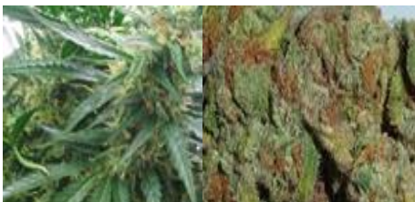
กัญชา, กัญชง