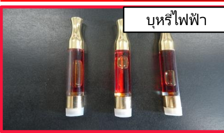
บุหรี่ปัฟไฟ