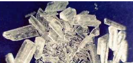
สารกระตุ้นประเภท เมทแอมเฟตามีน หรือ ไอซ์, ยาบ้า

*การใช้กัญชาในญี่ปุ่นและการนำเข้าสารออกฤทธิ์ต่อจิตประสาทใหม่ (NPS) ไปยังญี่ปุ่นเป็นสิ่งต้องห้ามตามกฎหมายปัจจุบัน