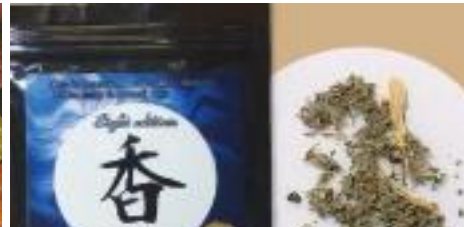
สารออกฤทธิ์ต่อจิตประสาทใหม่ (NPS)