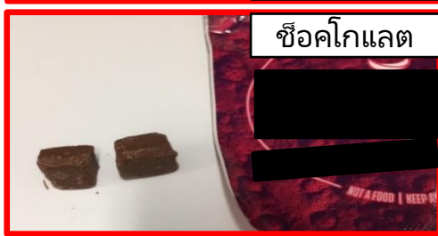
ช็อกโกแลต