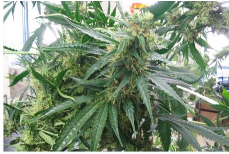
● Cần sa