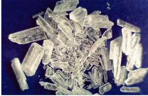
● Chất kích thích

Trường hợp buôn lậu hay sở hữu một trong các loại ma túy dưới đây (một vài ví dụ điển hình) sẽ bị xử phạt