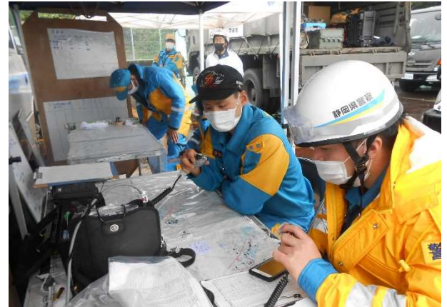
現地指揮所での活動状況