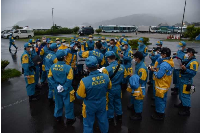
救出救助活動の打合せ状況