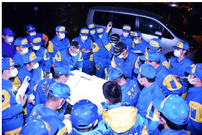
夜間における救出救助活動打合せ状況