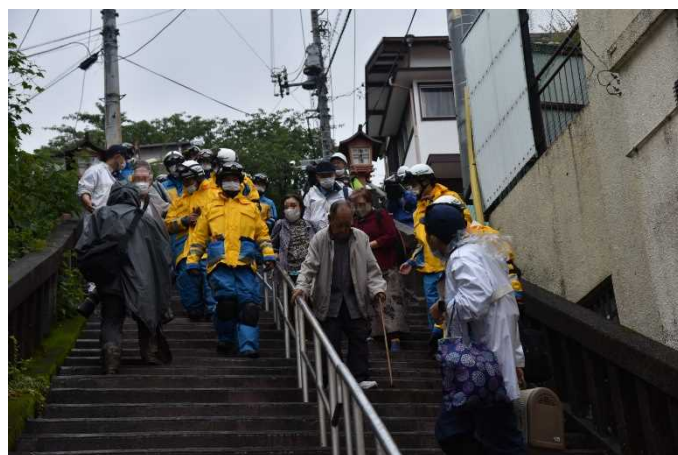
高齢者等の避難誘導状況