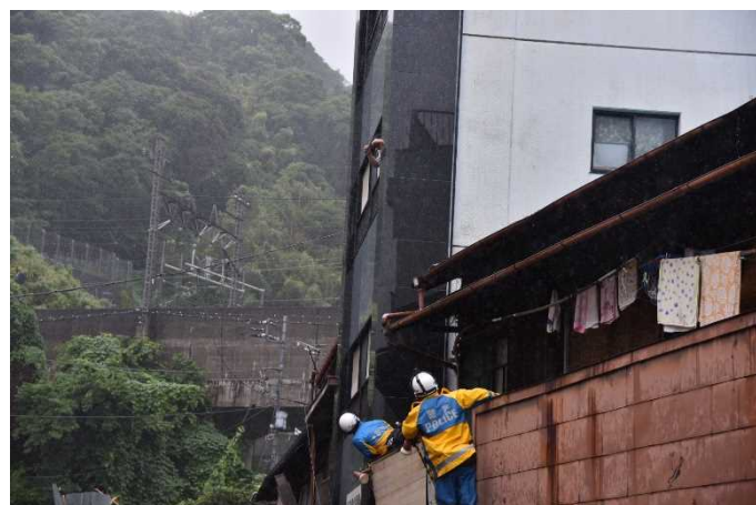
避難困難者の確認状況