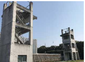
レンジャー訓練塔