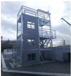
高所訓練ユニット