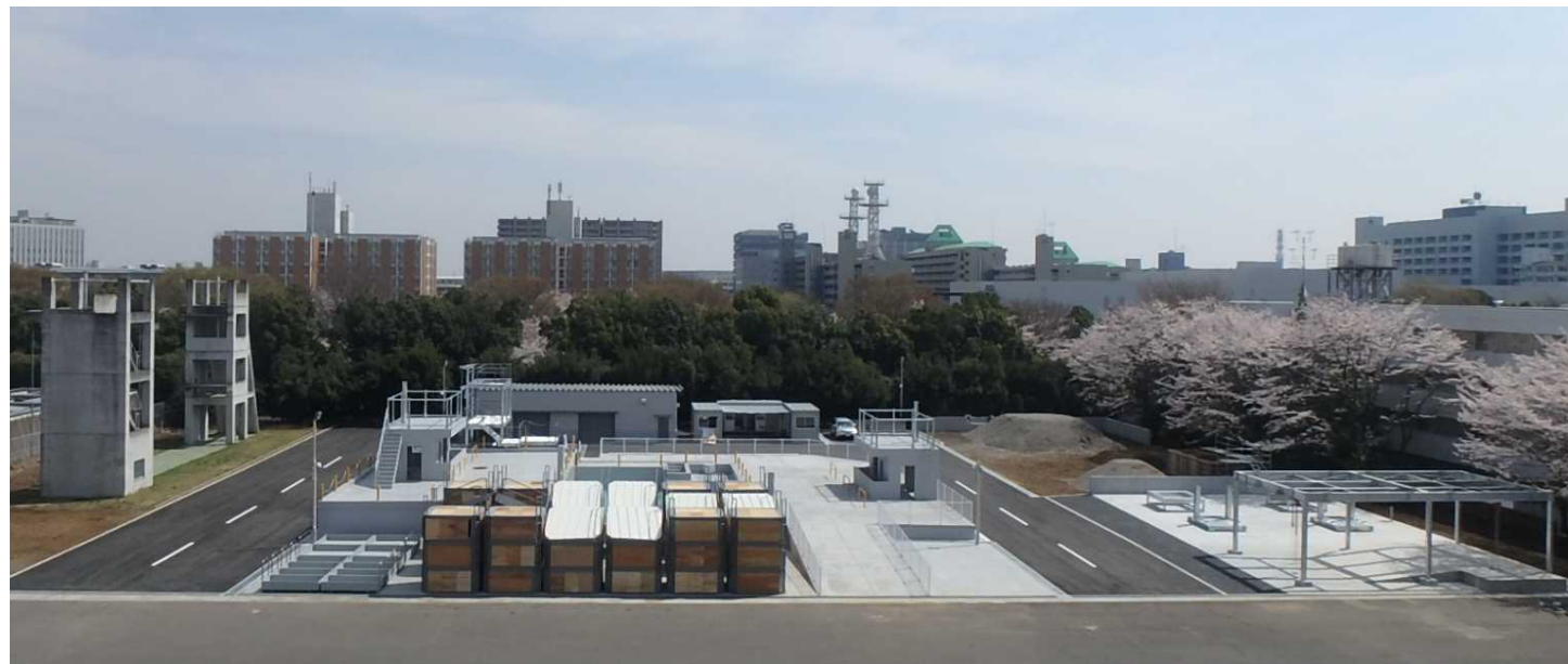
警視庁・東日本災害警備訓練施設 (東京都立川市)