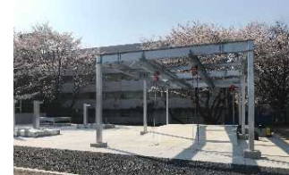
重量物排除訓練ゾーン