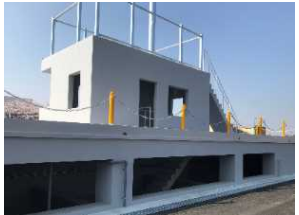
ビル倒壊対応訓練ゾーン