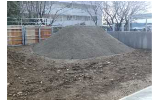
土のう作成訓練ゾーン