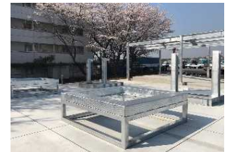
外壁・床破壊訓練ユニット