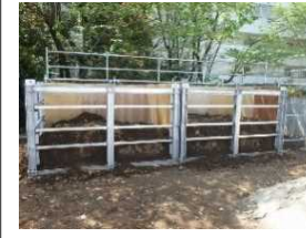
土砂埋没建物ユニット