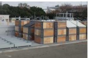
可変式訓練ユニット