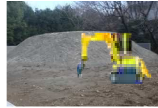
重機操作訓練ゾーン