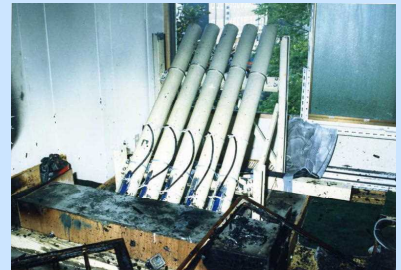
ゲリラ事件の発射装置 (昭和61年5月)