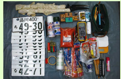
反主流派非公然アジトから押収された火薬、偽造パブプレート等

注3:全日本鉄道労働組合総連合会(JR総連)及び東日本旅客鉄道労働組合(JR東労組)には相当浸透しているとみられる