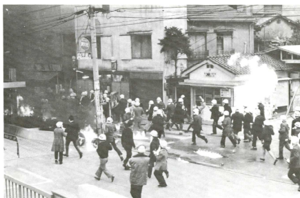
渋谷暴動事件（昭和46年11月）