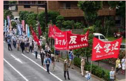
改憲阻止等を主張したデモ