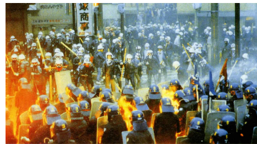
成田空港反対闘争（警備部隊を攻撃する極左） （昭和60年10月）