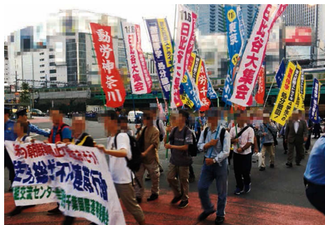
極左暴力集団によるデモ