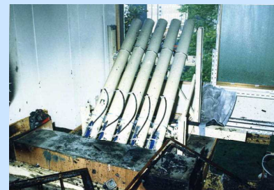
ゲリラ事件の発射装置 (昭和61年5月)