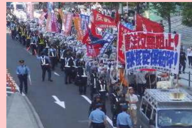
改憲阻止等を主張したデモ