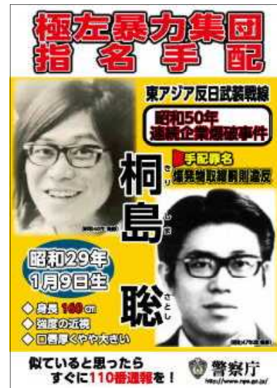
指名手配被疑者の発見・通報を訴えるポスター