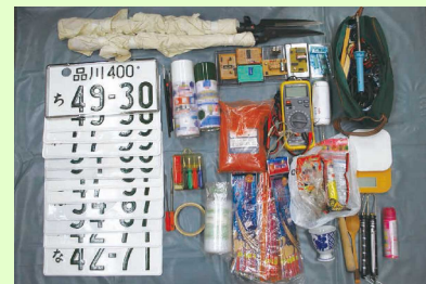
反主流派非公然アジトから押収された火薬、偽造ナンバープレート等