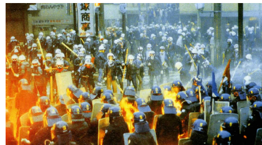
成田空港反対闘争（警備部隊を攻撃する極左） （昭和60年10月）