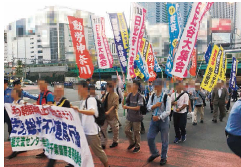
極左暴力集団によるデモ