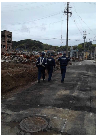
◆ 輪島市等において警戒活動等を実施