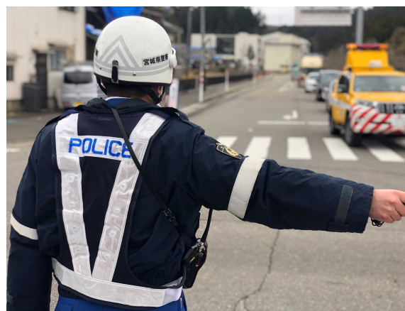
交通整理による安全で円滑な道路交通の確保