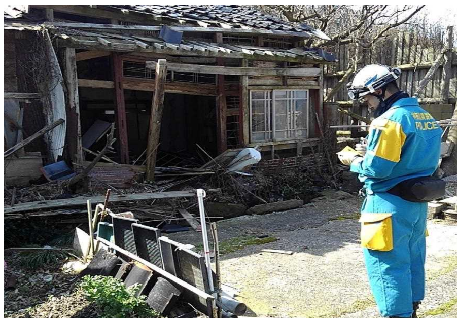
輪島市における警戒