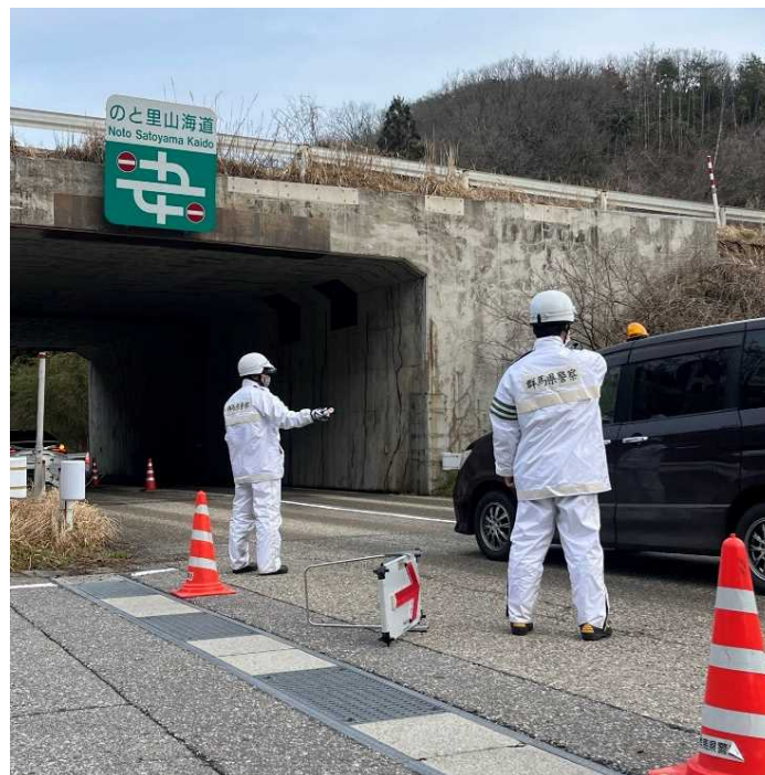
◆ 輪島市等において警戒活動等を実施

◆ 石川県警察と共に、警視庁、茨城県警、富山県警、奈良県警(約120人)が、羽咋市や穴水町等において、交通整理等を実施