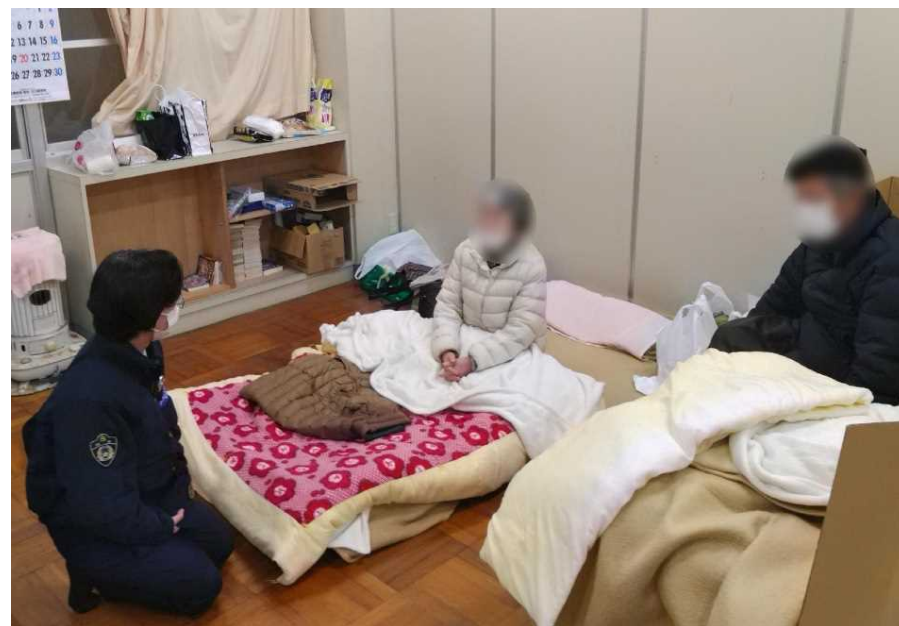
避難所における相談対応