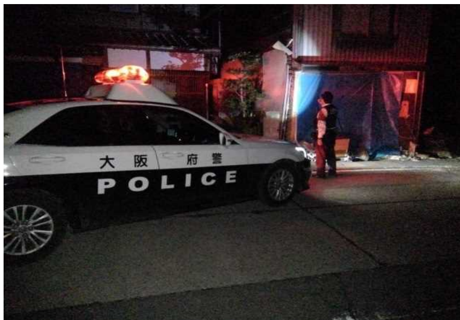
輪島市におけるパトロール