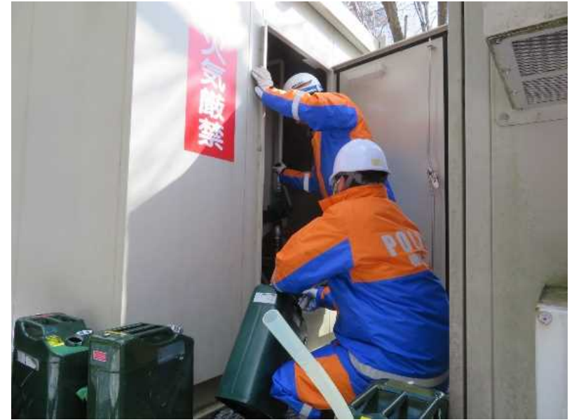
道路が寸断された警察通信施設における機能維持作業