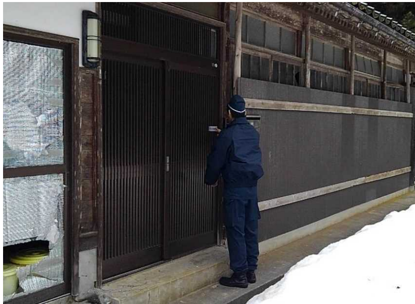
輪島市における機動隊員によるパトロール