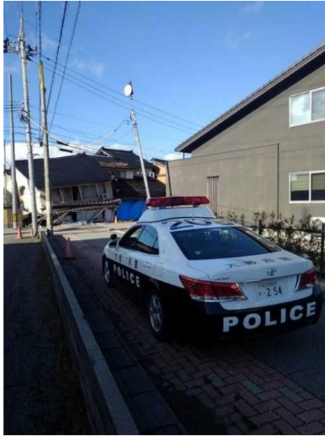
七尾市におけるパトロール