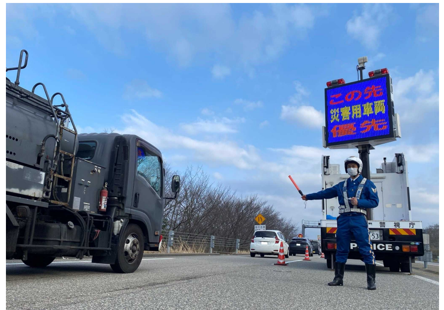
のと里山海道における交通規制