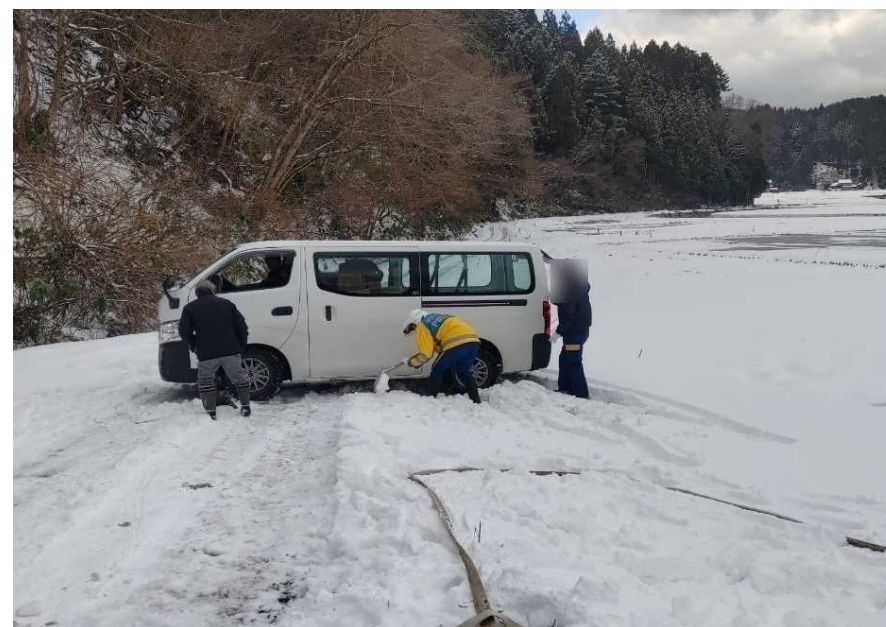
スタック車両の救助