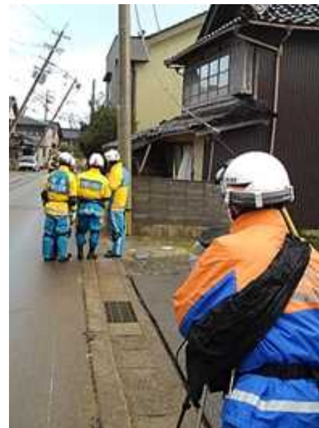
被災状況を把握するための撮影及び本部等への映像伝送