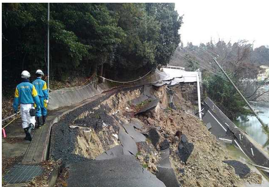
土砂崩れ現場における捜索