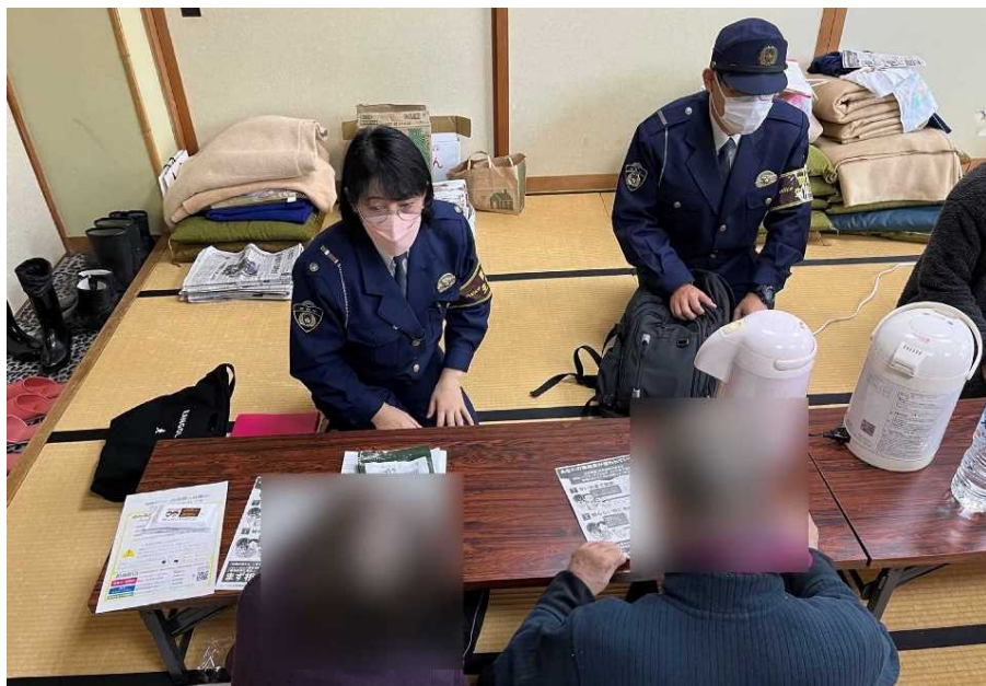
避難所における相談対応