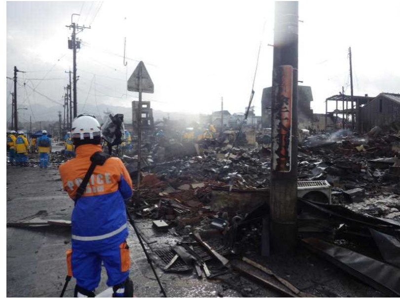
被災状況を把握するための撮影及び本部等への映像伝送