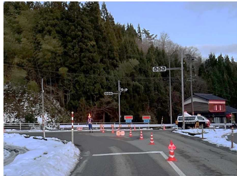
穴水町における交通規制