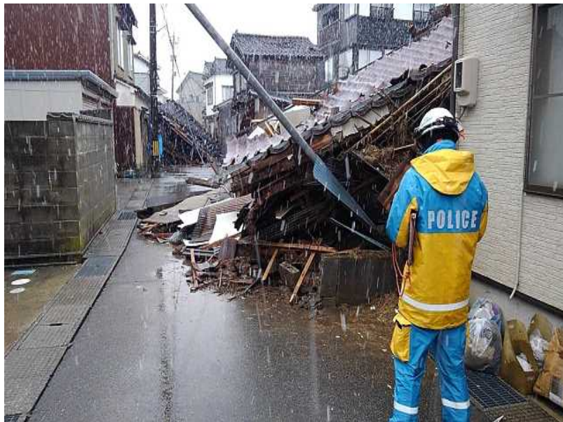
輪島市内における倒壊家屋の搜索