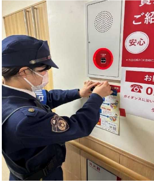
避難所における防犯リーフレットの掲示