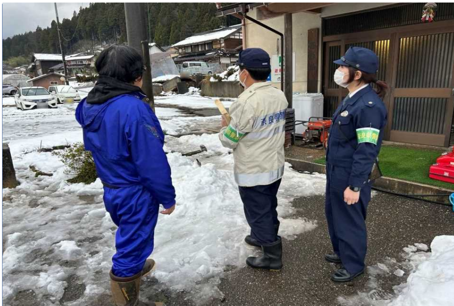
避難者からの相談対応