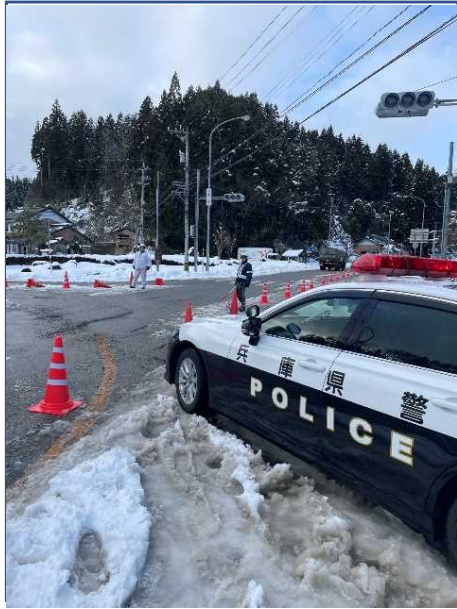
信号機が滅灯した交差点における交通整理