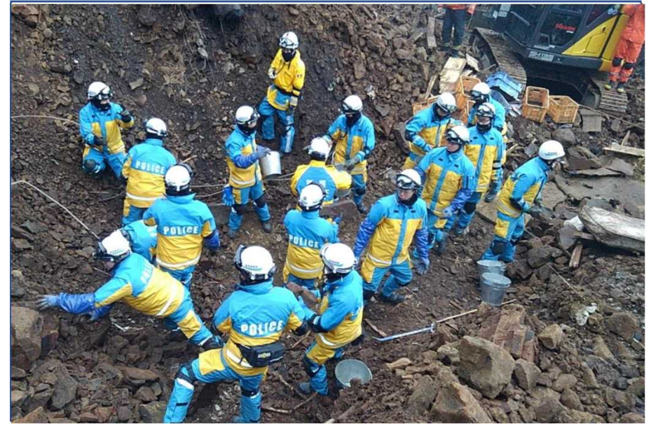
土砂崩れ現場における搜索等