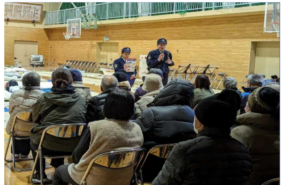
避難所における防犯指導等