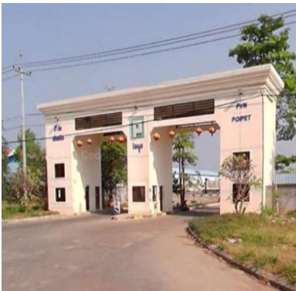
(左) 詐欺拠点の門扉