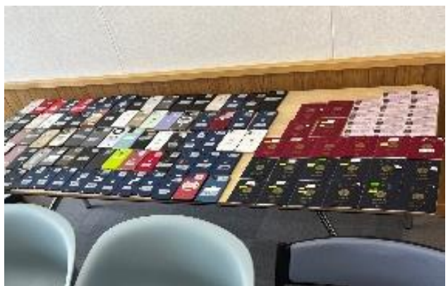
(右) 犯行グループが渡航者から没収していた携帯電話、パスポート、身分証等