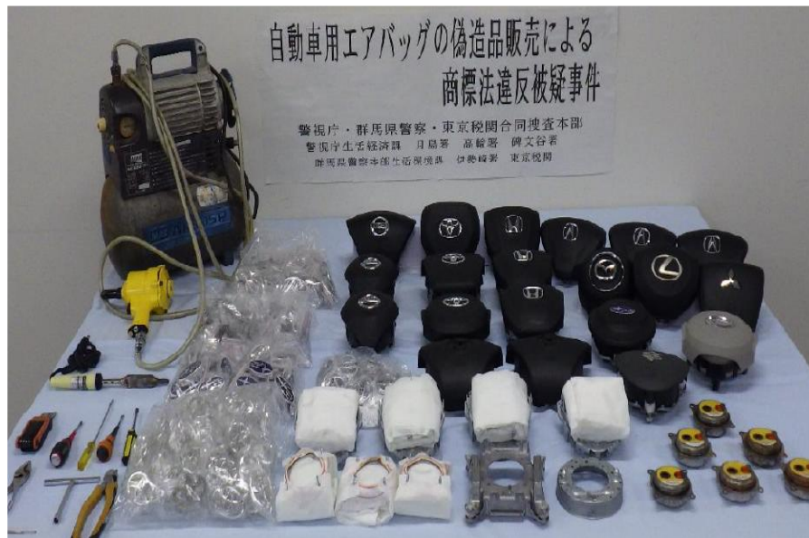
警察で押収した証拠品

令和5年2月までに、同男ら4人を商標法違反（使用）及び関税法違反（商標権を侵害する物品の輸出未遂）で検挙した。