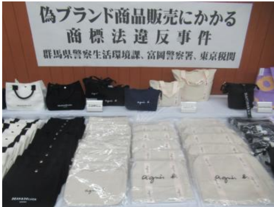
警察で押収した証拠品

令和7年9月までに、同男ら4人を商標法違反(使用)及び組織的犯罪処罰法違反(犯罪収益等隠匿等)等で検挙した。