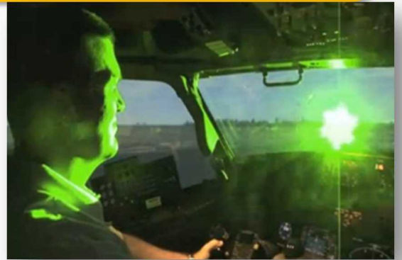
■レーザー光線による操縦士への影響(イメージ)

神奈川県内、東京都内及び沖縄県内で飛行中の航空機に対してレーザー光線を照射するという事案が多発しています。