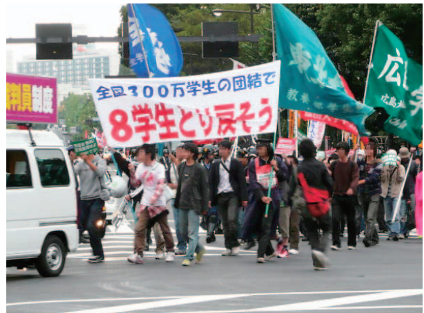
「6・14労働者総決起集会」開催時のデモ(6月、東京)

中核派(党中央)(以下「党中央」といいます)は、現在の社会経済情勢をとらえて「百年に一度の革命情勢」などと主張し、労働運動等に介入して組織の維持、拡大を図りました。 党中央は、年初から、「生きさせろ!ゼネスト」をスローガンに、政府や日本経済団体連合会に対して「雇用確保」などを訴える集会、デモに取り組み、同派が雇用問題に力を入れていたことをアピールしました。また、