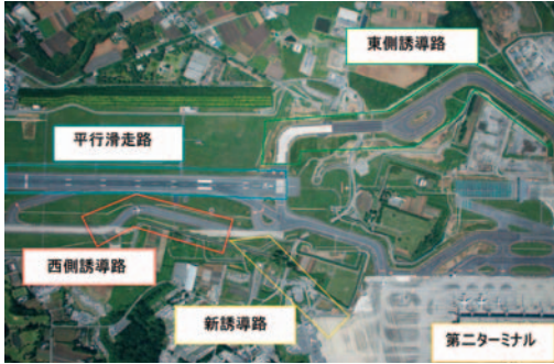
成田国際空港の平行滑走路とその誘導路

成田国際空港株式会社は、二二年七月二九日、更なる機能拡充と安全性の向上に向け、平行滑走路と第二ターミナルとを結ぶ新誘導路の建設計画、西側誘導路の改良計画（「へ」の字に曲折した部分を緩やかな線形にするもの）等を公表するとともに、新たに東側に建設した誘導路を、同月三〇日に、二、五〇〇メートルとなった平行滑走路を一〇