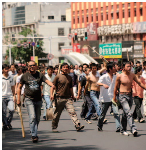
新疆ウイグル自治区で発生した暴動の様子

先端科学技術保有企業、防衛関連企業、研究機関等に研究者、技術者、留学生等を派遣するなどして、長期間にわたって、巧妙かつ多様な手段で、様々な情報収集活動を行っていると考えられます。