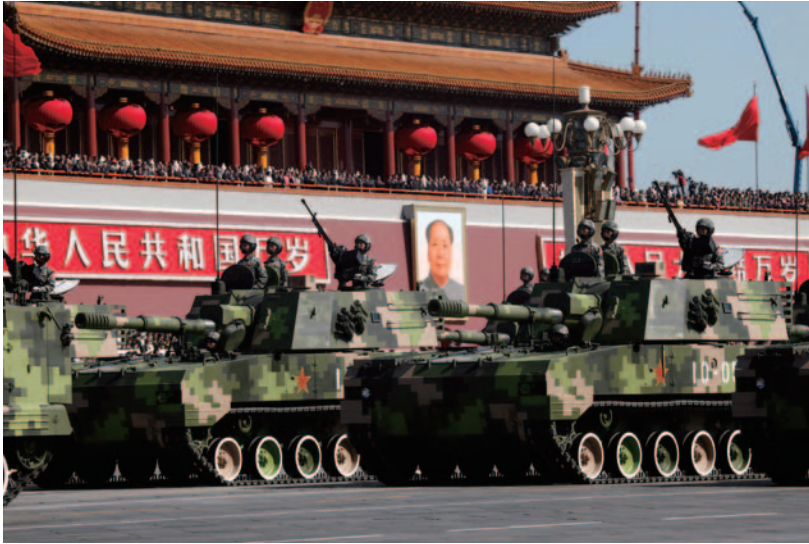
建国六〇周年に行われた軍事パレード

二二年は、建国六〇周年を迎えた中国が、国内外に向け、三〇年余の改革開放路線の成果を誇示し、共産党による統治の正統性を強調した一年でした。