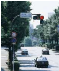
歩車分離式信号機