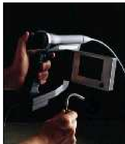
搜索活動用資機材