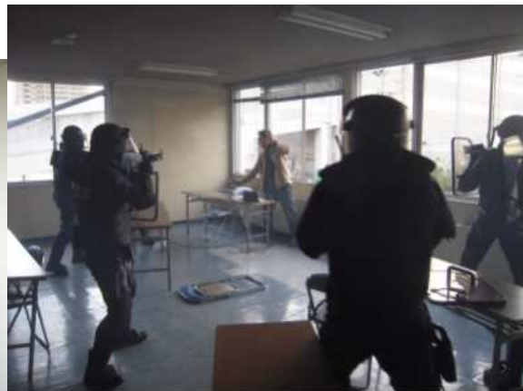
突入及び制圧訓練状況