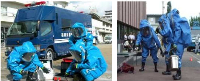
NBCテロ対応専門部隊