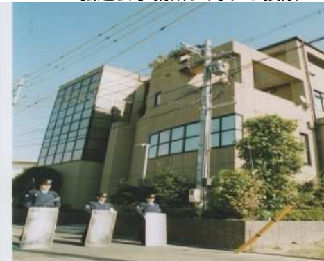
弘道会事務所に対する搜索