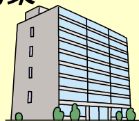
警察庁 (犯罪鑑識官)