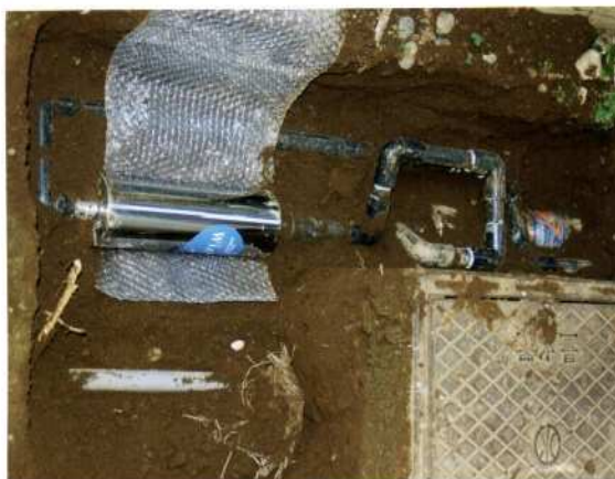
悪質業者が取りつけた高額・不要な活水器（関東地方）

住宅や水道設備の無料点検を装って家庭を訪問し、勝手に床下などを点検したうえで、「 床下の湿気がひどく基礎が腐っている。 」「 水道水にさびが混じっている。 」などとウソをついて、まったく必要がない工事を施工したり、活水器を取りつけたりした事件が検挙されています。