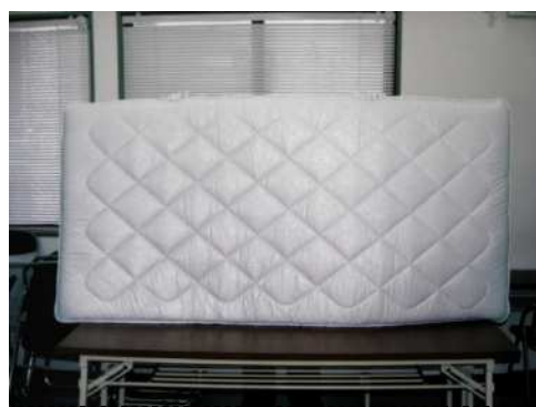
悪質業者が高額で販売していた敷き布団(京都)

高額な商品を販売するため、勝手に家に上がり込んで、長時間居座ったり、大声で脅かしたりして、高額な羽毛ふとんや磁気ふとんなどを無理やり売りつけていた事件が検挙されています。中には、翌日の未明まで居座って「買うまで帰らない」「わがままもいい加減にしろ」などと大声で怒鳴りつけて、無理やり売りつけていたケースもあります。