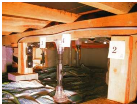
悪質業者が施工した高額・不要な床下耐震補強・調湿工事（栃木）

住宅や配管の無料点検を装って家庭を訪問し、「基礎が腐っているので、このままでは家が倒れる」「水道管がさびている」などとウソをついて、まったく必要がない工事を施工したり、浄水器を取りつけたりした事件が検挙されています。