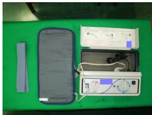
悪質業者が高額で販売していた電気治療器(千葉)

高額な商品を販売する目的を隠して、日用雑貨品を格安で販売するなどウソの宣伝をして民家や空き店舗に客を集め、雑貨品を無料で配るなどした後に、高額な家庭用電気治療器などを売りつけていた事件が検挙されています。